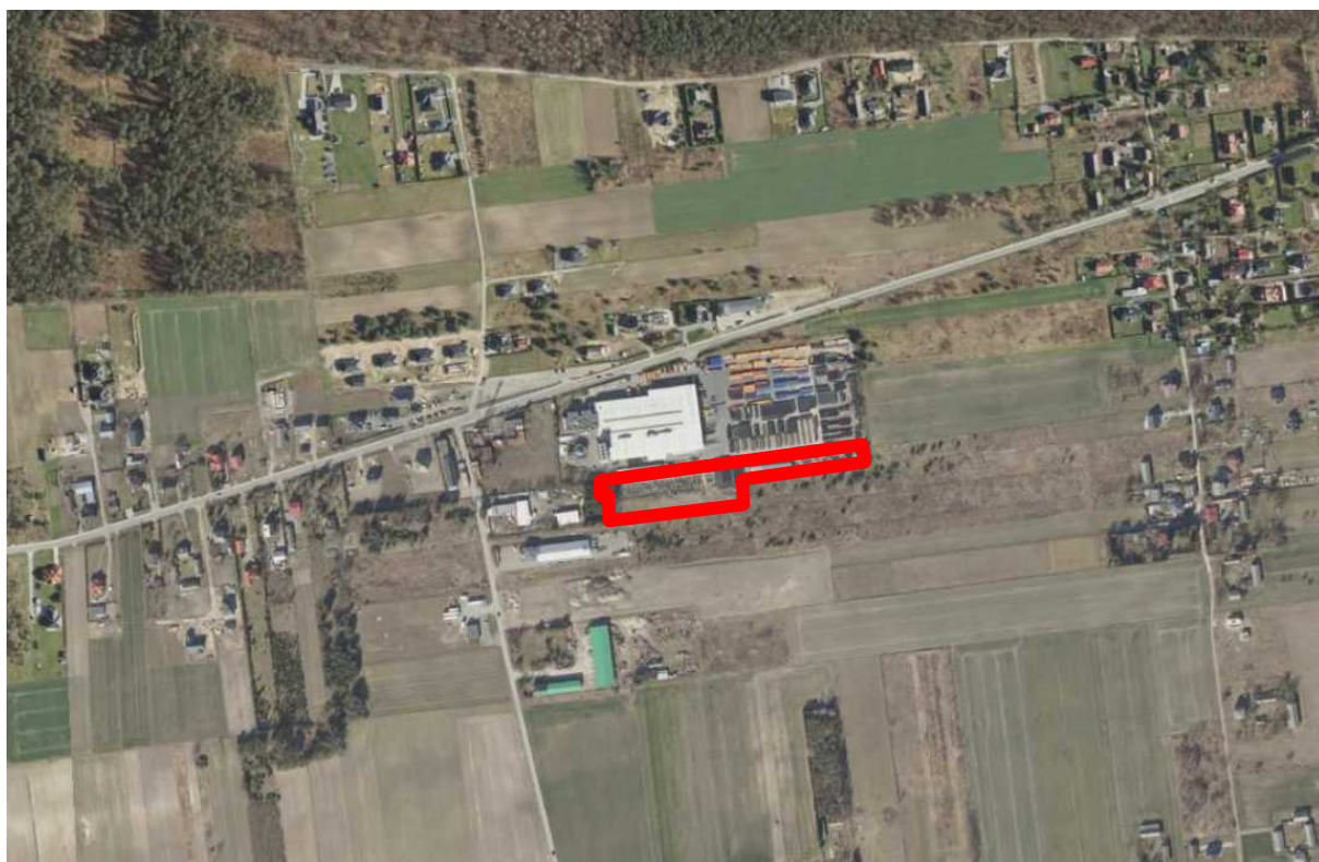
Rysunek 1. Granica obszaru objętego opracowaniem

Projekt Planu nie narusza ustaleń Studium uwarunkowań i kierunków zagospodarowania przestrzennego gminy Głusk, przyjętego uchwałą Nr V/37/19 Rady Gminy Głusk z dnia 24 stycznia 2019 r. w sprawie uchwalenia Studium uwarunkowań i kierunków zagospodarowania przestrzennego gminy Głusk.